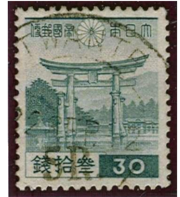
Japanse zegel voorzien van opdruk voor gebruik in Birma

Gedurende de bezetting werden in eerste instantie Japanse zegels overgedrukt met nieuwe waarden. Daarna werden eigen zegels uitgegeven voor Birma, o.a. de Farmer-uitgifte. Hoewel het een goedkope frankierserie is, bestaan er reprints en vervalsingen van.