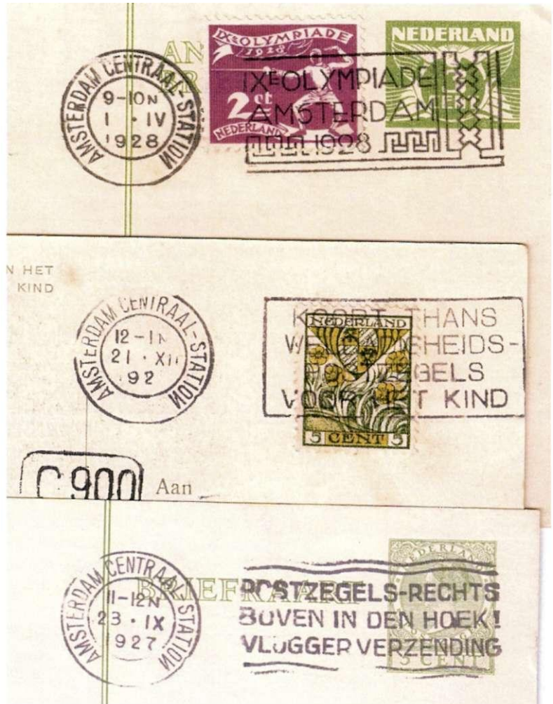
92 Drie afdrucken met stempel Amsterdam Centraalstation in de periode eind september 1927 - 2 april 1928, met spiegelbeeldige N in StatioN, data resp. 23 september 1927, 21 december 1927, en 1 april 1928.