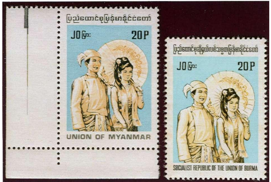
Rechts frankkeerzegel met de oude landsnaam "Socialistic Republic of the Union of Burma", links met de nieuwe landsnaam "Union of Myanmar"

De onafhankelijkheid van Birma is geen succesverhaal. Op 19 juli 1947 werden een aantal belangrijke leiders van de toekomstige regering vermoord waaronder de nationale held Bogyoke Aung San. Voor hen werd een jaar later een serie zegels uitgegeven.