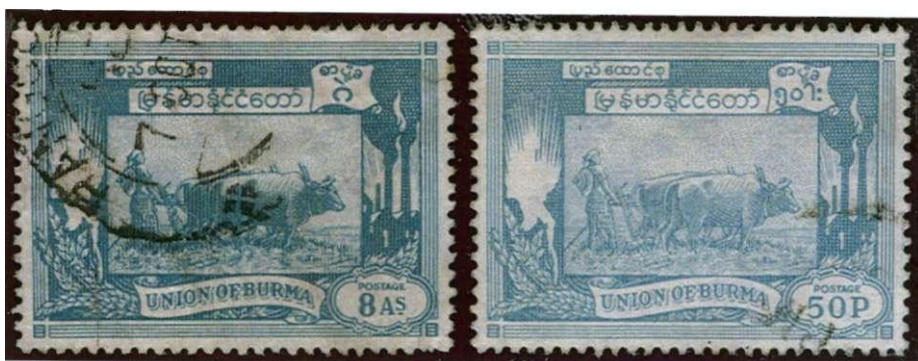
links frankerzegel in de oude Indiase munteenheid, rechts in de nieuwe munteenheid