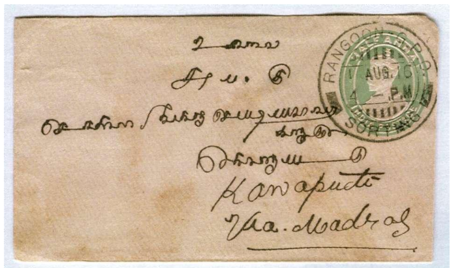
Postwaardestuk van India gebruikt in Birma (stempel RANGOON-G.P.O. SORTING). Verstuurd naar Konapet in India via Madras.