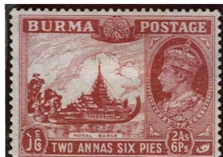
Eerste eigen uitgifte van Birma