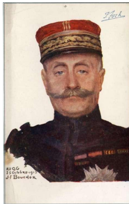
Maarschalk F. Foch: Hij werd in maart 1918 opperbevelhebber van de geallieerde troepen aan het westelijk front en was hoofd van de geallieerden bij de onderhandelingen voor de wapenstilstand die inging om 11 uur op 11 november 1918.

Meteen daarna ging hij studeren aan de Katholieke Universiteit van Nijmegen, in de richting Biologie. Al binnen enkele jaren werd hij - al student assistent - gevraagd om practicumleider te worden, en daar ontdekte hij zijn roeping voor het geven van onderwijs.