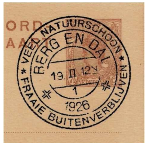
Afdruk van Reclamehandstempel van Berg en Dal, 19 februari 1926, met reclame voor lokaal toerisme.

van 10.00-12.00 uur in het "Kolpinghaus", Kolpingstrasse 11, Kleef. Iedereen is van harte welkom !