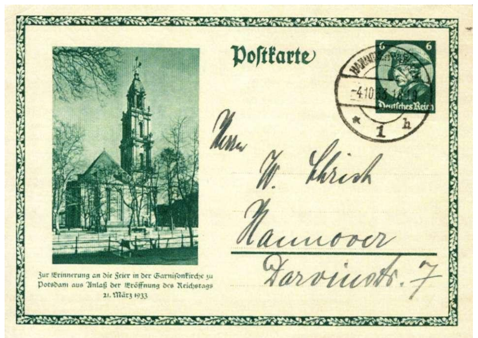
Afbeelding 7, Garnisonkirche in Potsdam