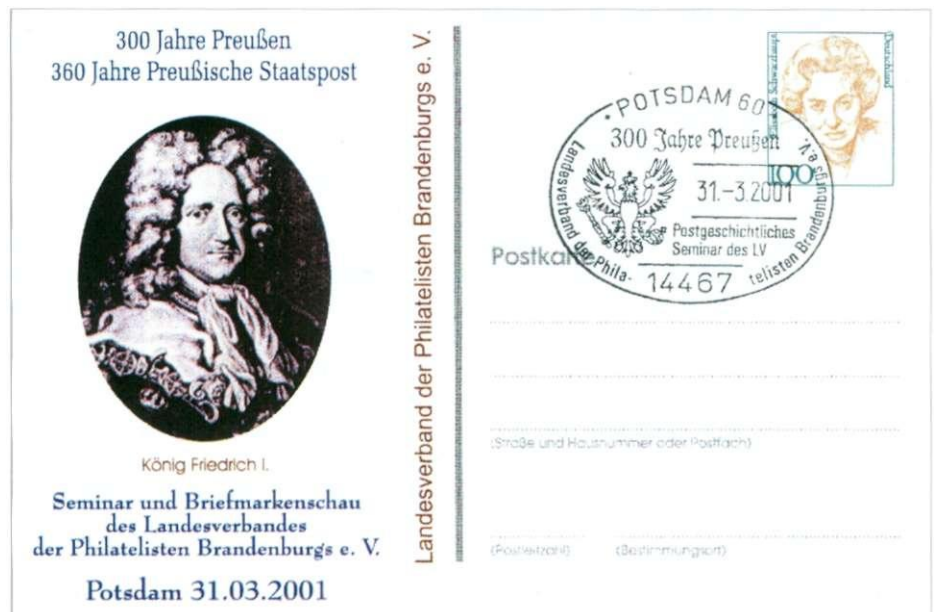
Afbeelding 2, Koning Friedrich I

Ofschoon Friedrich II geen voorstander was van de bouw van de Branden-