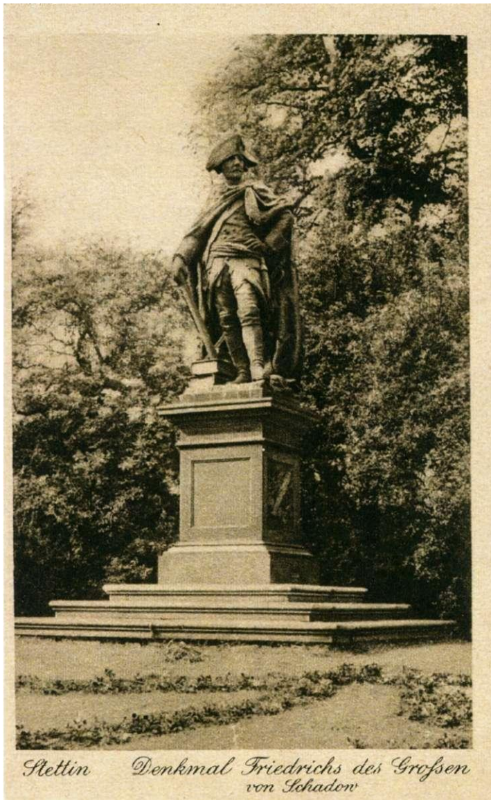
Afbeelding 4, Standbeeld van Friedrich der Große in Stettin

vrienden en personeel uitnodigde (afb 6, schilderij, genaamd "Das Flötenkonzert").