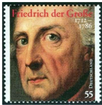
Afbeelding 1, Friedrich der Große

Friedrich had zich ontpopt als een groot strateeg, die na zijn dood nog vele bewonderaars had. Daaronder