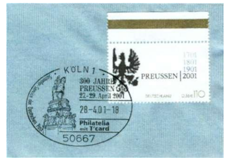
Afbeelding 5 Stempel uit Keulen met een standbeeld in Berlijn

Na zijn dood werd zijn stoffelijk overschot bijgezet in de Garnisonkirche te Potsdam (afb 7), naast het graf van zijn vader. In de laatste maanden van de Tweede Wereldoorlog werd het gebalsemde lichaam naar een zoutmijn in Thüringen overgebracht om te voorkomen dat het in handen van het Roder Leger zou vallen. Tijdens het einde van deze oorlog brandde de kerk volledig uit. Vanaf 1952 vond hij zijn volgende rustplaats in het stamslot Burg Hohenzollern.