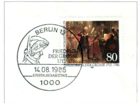
Afbeelding 6 Schilderij "Das Flötenkonzert"

Op 17 augustus 1991 is hij uiteindelijk, conform zijn testament, met groot vertoon bijgezet op het terras van "zijn Sanssouci", als bezegeling van de nieuwe Duitse eenheid.