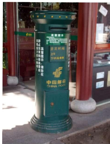
Brievenbus bij de "Yellow Crane Tower".

De toegangkaart vond ik erg groot, maar op de voorkant prijkte naast de controlestrook een mooie afbeelding van de Yellow Crane Tower. Op een gegeven moment keek ik bij toeval op de achterkant van de toegangkaart en zag daarop de tekst "china post" en een voorgedrukte zegel met als beeld de toren. Navraag bij mijn begeleidsters leerde mij dat de kaart verstuurd kon worden in het binnenland. Van hen kreeg ik de kaarten zodat ik nu over 3 exemplaren beschikte. Een ongebruikt exemplaar had ik nodig om te kunnen laten zien hoe het eruit zag.