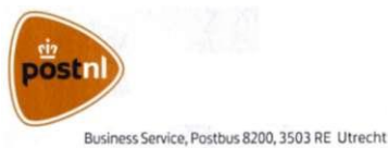
Afb. 33 Dienstenvelop

Op internationaal gebied hebben nationale postbedrijven elkaar nodig. Een mooi voorbeeld van de samenwerking tussen PostNL en Deutsche Post is het hier afgebeelde formulier. Het was gevoegd bij een zending van een Duitse boekhandelaar aan een Nederlandse klant. Die klant kan het gebruiken als hij de zending terug wil sturen: één gedeelte dient als voorgefrankeerd retourretiket, het andere als verzendbewijs.