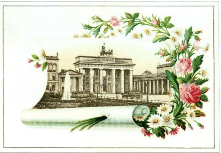
afb. 10 enveloppe links, kaart rechts

De Brandenburger Tor is uit zandsteen opgetrokken. Ze is 65,5m breed, 11 m diep en (inclusief de Quadriga 8,40m) 26,0 m hoog. De zij-openingen zijn 3,79 m en de midden-opening is 5,65 m breed. Deze laatste opening was ingevolge § 23 van het Regelement van politie alleen toegelaten voor wagens van het keizerlijk huis.