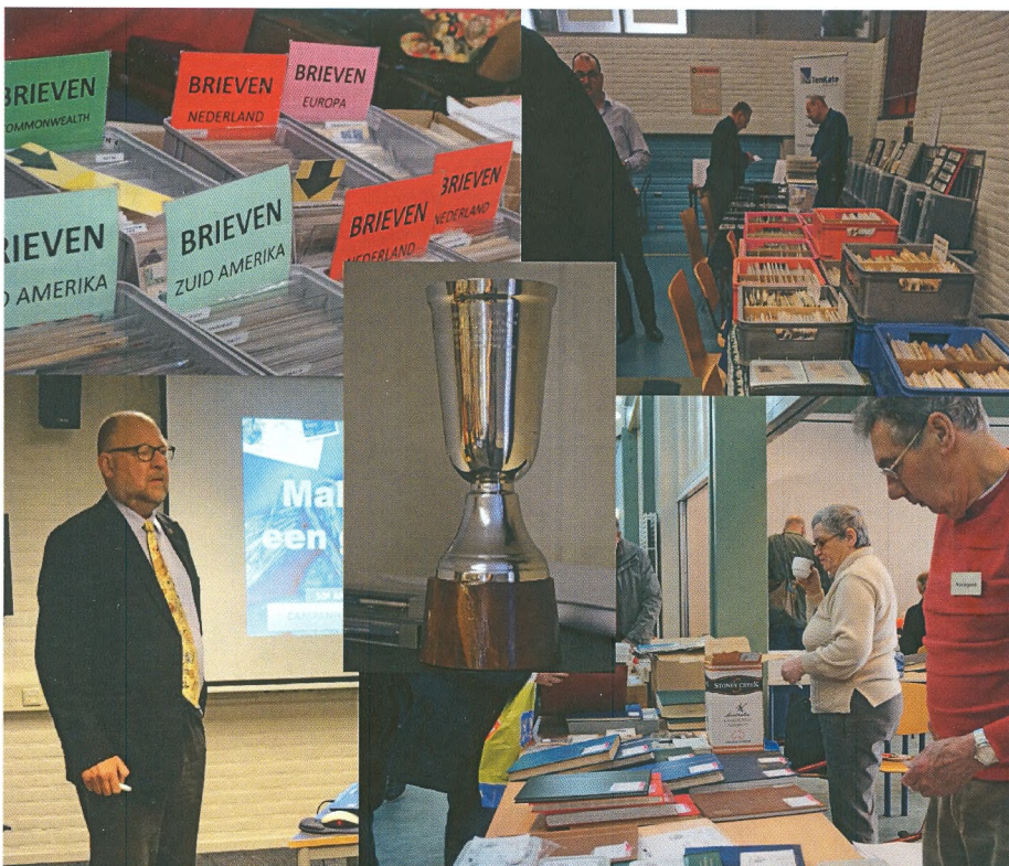
Impressie van Postzegel Totaal en het Jo Toussainttoernooi in 2015

Ook is er een tentoonstelling in het kader van de 100ste Vierdaagse Nijmegen door Marcel Claassen.