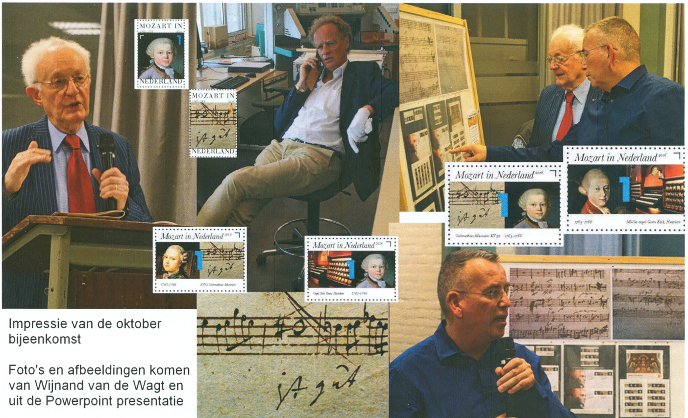
Impressie van de oktober bijeenkomst