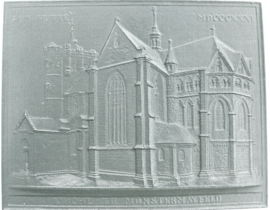
Kaart uit 1831 met de kerk uit Münstermaifeld