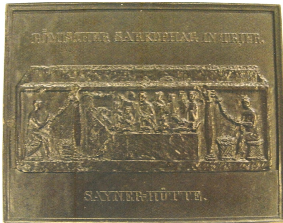
Kaart uit 1833 met motief sarkofaag in Trier.

F. Piers Tolhuis 35-17 6537 NN Nijmegen Tel. 024-3444208