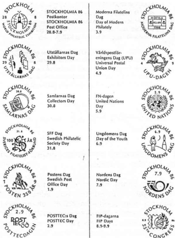
Afb.3 De verschillende dagstempels tijdens de tentoonstelling.

De woensdag was er om de dorpsjes in de omgeving te verkennen, zoals Penningby, Overby en Länna en de grotere plaats Norrtälje en ook om boodschappen te doen.