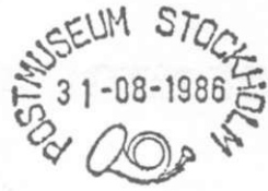
Afb.1 De twee verschillende stempels van het Postmuseum.

De maandag en dinsdag waren in hun geheel bestemd voor bezoek aan: