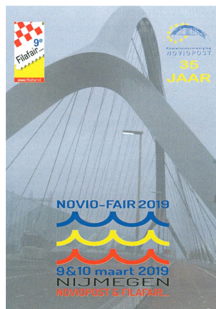
Voorzijde van het Jubileumboek