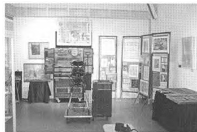
De drukkerij van het grafisch museum

Gedurende beide dagen zal er ook een mobiel grafisch museum aanwezig zijn. In een drukkerij anno 1930 schetst een conservator/drukker met 40 jaar ervaring in het drukkersvak, aan de hand van onder meer een handdegel en letterkast de ontwikkeling van de boekdrukkunst.