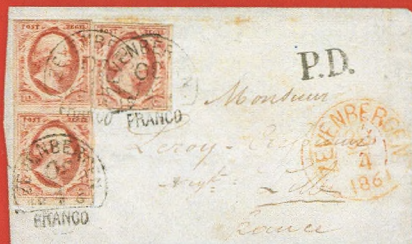
Halffrond-francostempel tegen de voorschriften gebruikt en met kopstaande datum!