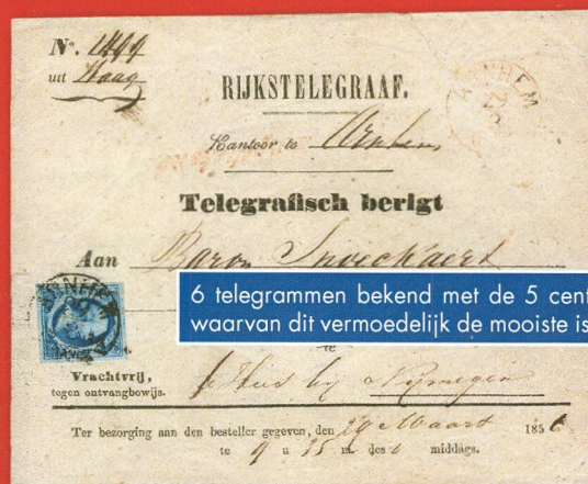
6 telegrammen bekend met de 5 cent, waarvan dit vermoedelijk de mooiste is!