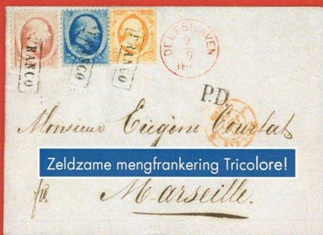
Zeldzame mengfrankering Tricolore!