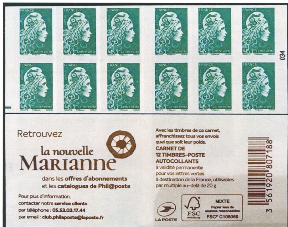
Afbeelding 11: Postzegelboekje, twaalf zegels 'Lettre verte' (post die vervoerd wordt met zo weinig mogelijk schade voor het milieu)

We roepen die even in herinnering (afbeeldingen 3-5). De gebruikte namen zijn die uit de Yvert-catalogus. Er bestaan ook Franse zegelreeksen die aangeduid worden met 'Marianne', maar die een ander symbolische vrouwentype tonen, met in plaats van de frygische muts een lauwerkrans (afb. 6).