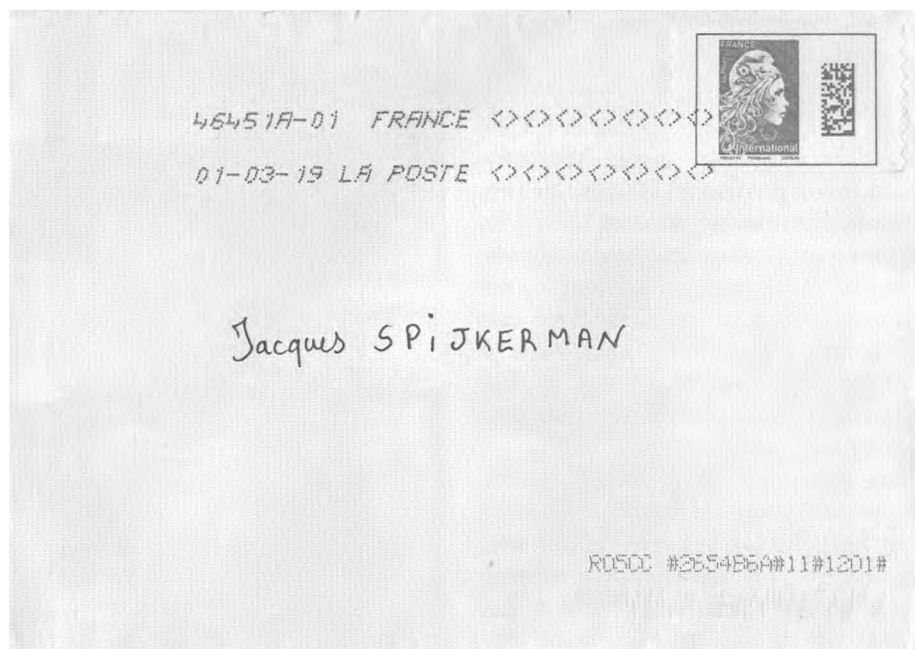
Afbeelding 13: brief gefrankeerd met postzegel 'International'

Het plezier van het verzamelen van langlopende postzegelreeksen zit hem in de variatie. Veel verschillende waarden, kleuren, verschijningsvormen, druktechnieken... En de nieuwe Marianne is wat dat betreft goed begonnen. In Nederland moeten we het doen met drie zegels van Koning Willem Alexander, waarbij gelukkig af en toe het jaartal of een foute kroon aangepast wordt. Van 'Marianne l'engagée' zijn binnen een jaar tijd al minstens 36 varianten verschenen. Gegomde en zelfklevende zegels, velzels en rolzels, postzegelboekjes en souvenirblokken (afb. 8-11).