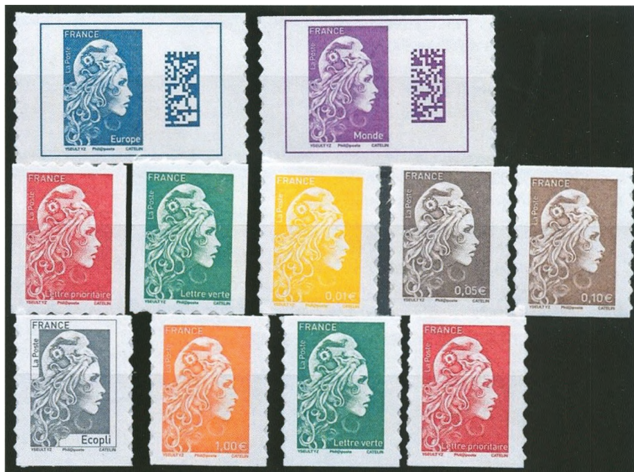
Afbeelding 9: Zelfklevende rolzegels in verschillende waarden