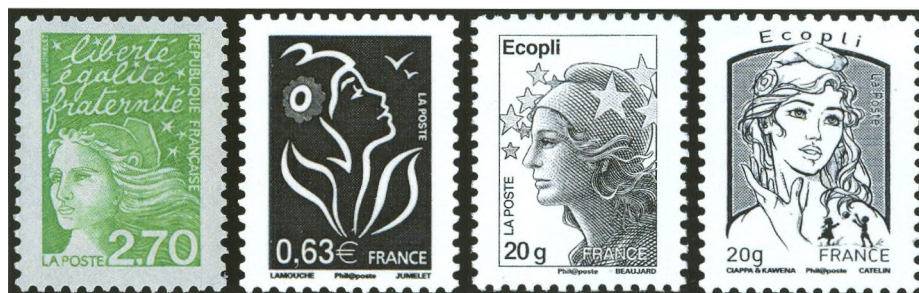
Afbeelding 5: Marianne du 1 Juillet (1997), de Lamouche (2005), de Beaujard (2008) en de la Jeunesse (2008)