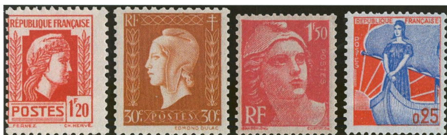
Afbeelding 3: Marianne d'Alger (1944), de Dulac (1945), de Gandon (boekdruk, 1948) en à la nef (boekdruk, 1959)

werken, de series 'Beroemdheden' en de langlopende reeksen met 'gewone' postzegels voor dagelijks gebruik. Denk aan Marianne.