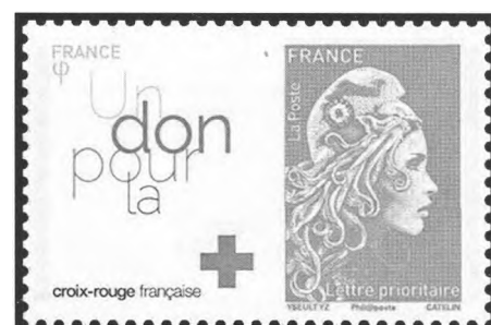
Afbeelding 10: Zegel met toeslag voor het Rode Kruis

Postzegels spelen ook wel eens een rol in de literatuur. Zo ook in de novelle "Oeroeg" van Hella S. Haasse uit 1948: