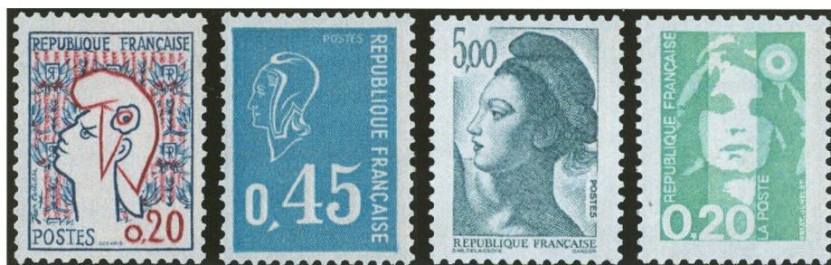
Afbeelding 4: Marianne de Cocteau (1961), de Béquet (1971), Liberté (1982) en du Bicentenaire (1989)

Al jaren verzamel ik Franse postzegels en ik weet dat mijn verzameling nooit compleet zal zijn. Ik had lang een nieuwtjes-abonnement, dat me minimaal honderd nieuwe postfrisze zegels per jaar opleverde, nog afgezien van de velletjes, blokjes en boekjes. Steeds meer onzinnige onderwerpen, steeds grotere series, steeds meer van hetzelfde. Het verzamelen werd een dure hobby die steeds minder plezier opleverde. Ik werd een klager. Klagen, klagen... en toch maar kopen! Uiteindelijk ben ik gestopt. Met dat abonnement, maar niet met verzamelen. Franse zegels hebben charme. Denk aan de prachtige reeks grootformaat-zegels met afbeeldingen van kunst-