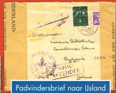
Padvindarsbrief naar IJsland