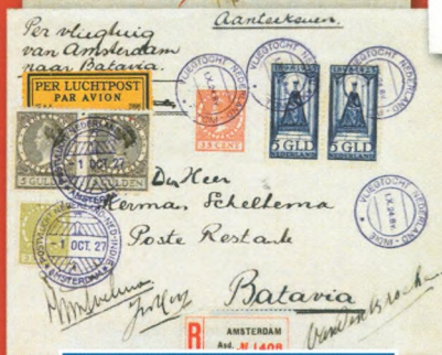
Van der Hoop- en Koppen- vlucht op 1 poststuk, uniek!