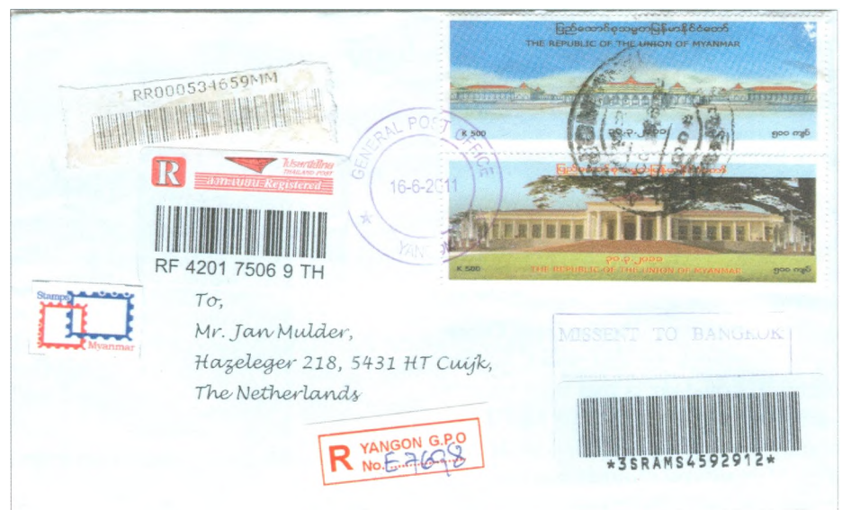
Afb. 4 Aangetekende brief met stempel "MISSSENT TO BANGKOK" en aantekenstrookjes van Myanmar en Thailand. Nederlandse barcode sticker.

mooie reeks kaarten voor Jan', dacht mijn vriend in Myanmar. Alle kaarten werden geadresseerd, van een postzegel voorzien en tegelijk op de bus gedaan. Op een zaterdagmorgen vielen alle kaarten tegelijk bij mij in de brievenbus en ze waren allemaal voorzien van een stempel "missent to thailand" (afbeelding 6 op de voorkant van het blad). De kaarten waren verzonden vanuit Nay Pyi Taw, de nieuwe hoofdstad, en kregen ook het stempel van het postkantoor op de luchthaven Mingalodon bij Yangon, dat de post naar het buitenland verzorgt. Meer dan tien kaarten met een missent-stempel tegelijk is zelfs voor een statisticus als ik, te veel van het goede. Er moest dus iets anders aan de hand zijn dan simpelweg toevallig alles in de verkeerde postzak.