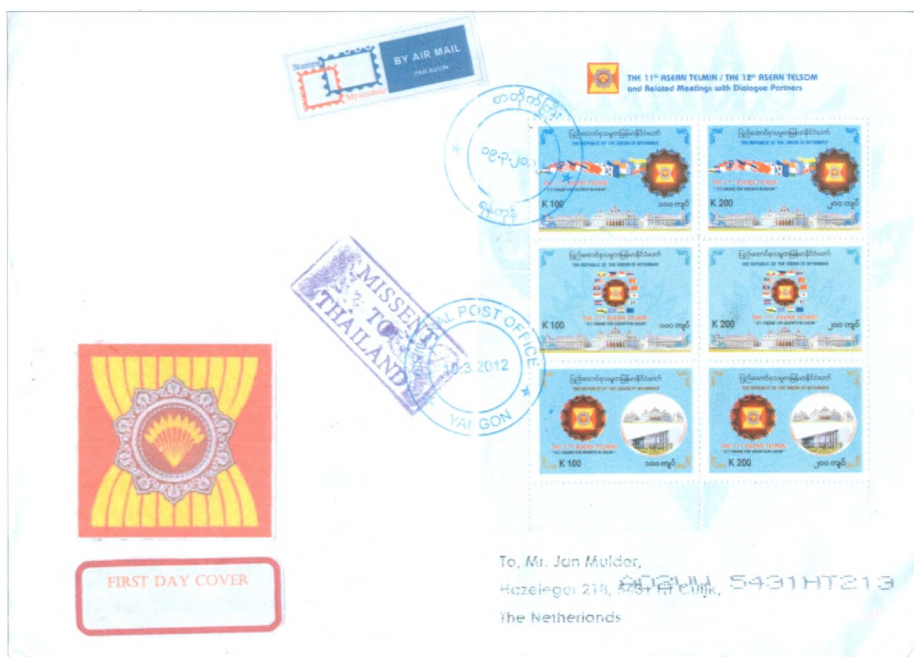
Afb. 5 Eerstedag envelop met stempel "MISSSENT TO THAILAND".