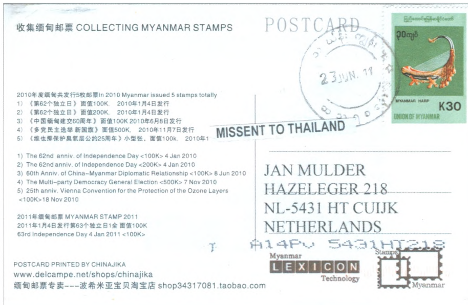
Aft). 3 Kaart naar Nederland met strookje "MISSSENT TO THAILAND".

Zoals blijkt uit afbeelding 4 was men het plakken van strookjes zat en vanaf maart 2012 kwam de post voorzien van een keurig stempel "missent to thailand" (afbeelding 5). Er kwam nog wel post, maar zo onregelmatig dat het niet meer opviel dat alles voorzien was van een missent-stempel. Vanwege Facebook, Skype en de e-mail werd er vanaf de tweede helft van 2014 geen post meer vanuit Myanmar naar mij gestuurd. Einde verhaal missent, ogenschijnlijk.