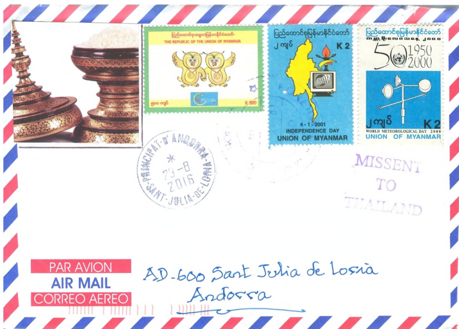
Afb. 7 Brief vanuit Myanmar naar Andorra met stempel "MISSENT TO THAILAND".

en waar die post dan naartoe gaat. Dan duiken er veel meer poststukken op als we bij Delcampe op zoek gaan. Vanuit Italië naar Finland, vanuit Duitsland naar Maleisië, vanuit Frankrijk naar Vietnam en nog meer. In afbeelding 8 zien we een poststuk vanuit Letland naar Andorra. Allemaal bestemmingen waar weinig post naartoe gaat.