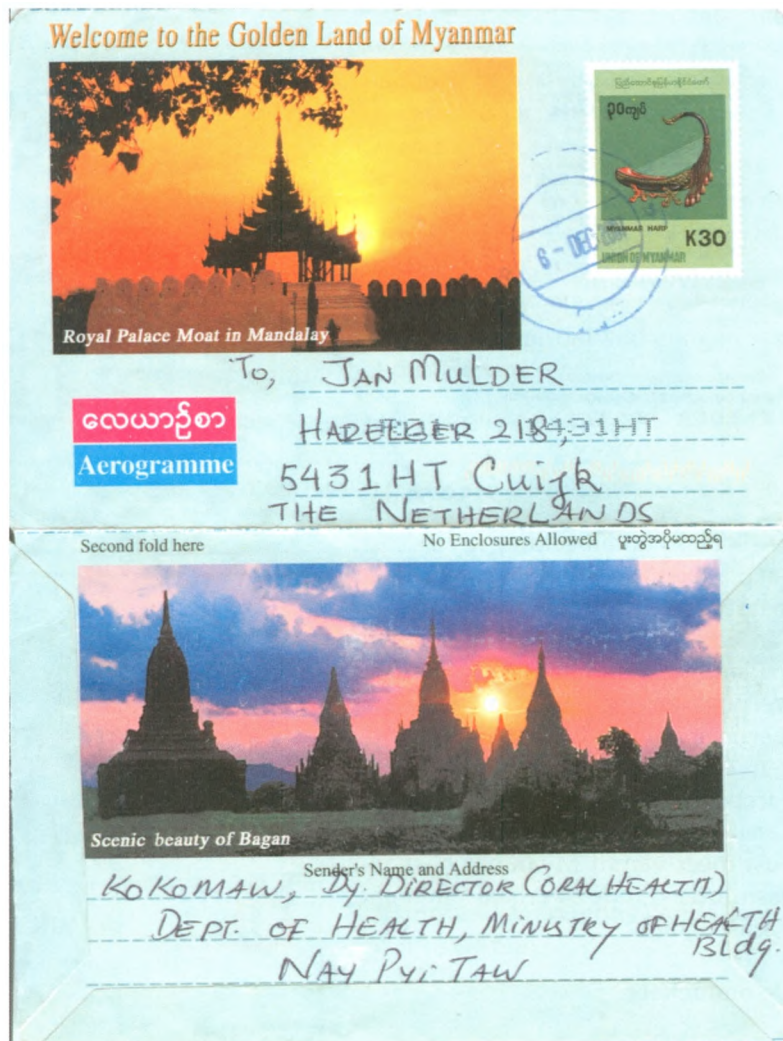
Afb. 2 Luchtpostblad van Myanmar verstuurd op 6-12-2007 naar Nederland.

Na mijn verblijf van twee weken in Myanmar in 2006 vanwege een project bedacht ik: waarom zou ik geen Birma/Myanmar gaan verzamelen? Iedereen verzamelt al Nederland, Duitsland, Frankrijk en dat soort landen dichtbij, dus daar is niet veel nieuws aan te beleven. In Myanmar had ik een contact vanuit het project. Aan de slag dus. Mijn vriend stuurde mij onregelmatig een mooi luchtpostblad (afbeelding 2), brief of kaart. Via internet