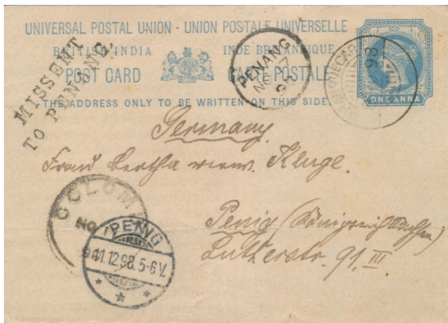
Afb. 1 Kaart naar Peinig in Duitsland met stempel "MISSENT TO PENANG".

kreeg ik een tweede contact in Myanmar zodat nieuwe uitgiften via de post binnenkwamen. Het uitgiftebeleid in Myanmar is wat gematigder dan in Nederland. De langlopende serie telt maar 6 zegels, dus daar ben je snel mee klaar. Daarnaast twee of drie uitgiften per jaar en dat is het. Veel post kwam er niet, want het meeste contact liep gewoon via de e-mail.