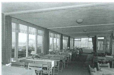
Het uitzicht vanuit de eetzaal op de Waal en Waalbrug