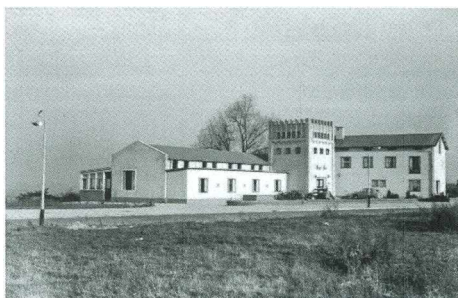
Hotel Restaurant Pays Bas op de Hunnerberg aan de Batavierenweg

Pays Bas had jarenlang een heel goede naam. Toch kende het pand met zijn karakteristieke kasteelachtige torentje een tamelijk bewogen geschiedenis. Het deed na sluiting van het restaurant achtereenvolgens dienst als studentensociëteit, Chinees restaurant, Joegoslavisch restaurant, Golden Ten-casino en op het laatst als zendstation voor piratenzenders. In 1989 werd het afgebroken en kwam er een appartementscomplex voor in de plaats.