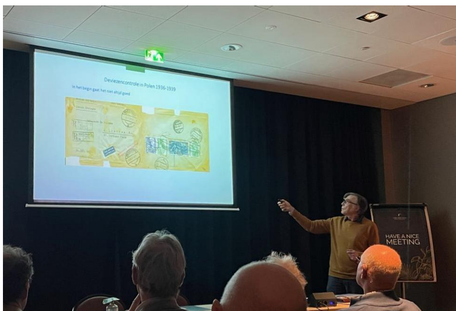
Novioposta - 3

Voor het volgende nummer van Novioposta kan copy ingeleverd worden tot 1 juni 2025.