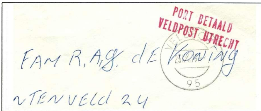
Afb. 1 Brief vanuit Libanon naar Nederland met stempel 'Veldpost 95' en 'Post betaald/Veldpost Utrecht',

Nederland heeft een bijdrage geleverd in Libanon van maart 1979 t/m oktober 1985 binnen UNIFIL (United Nations Interim Force in Libanon). Een tweede bijdrage die nog steeds geleverd wordt, is een groep verbindingsmensen en een detachement Koninklijke Marechaussee. De stempels die daar zijn gebruikt, zijn het bekende langstempel "Post betaald/Veldpost Utrecht" en het ronde datumstempel "Veldpost" (afb. 1). Doelmatig doch saai. Andere landen als Oostenrijk en Zweden maakten naast datumstempels ook gebruik van speciale stempels.