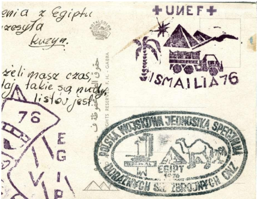
Afb. 8 Privaat stempel op kaart die in een enveloppe verstuurd is.

Een klein deel van de brieven wordt verzonden in enveloppen die vanuit Polen worden meegenomen. In Egypte en Syrië worden luchtpostenveloppen gekocht door de militairen en de meeste brieven worden hierin verstuurd (afb. 5). De Verenigde Naties heeft ook speciale luchtpostbladen beschikbaar. Een voorbeeld van dit luchtpostblad is te zien in afb. 10.