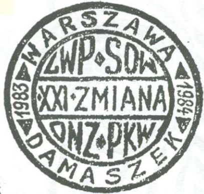
6 Verschillende stempelvormen uit diverse periodes.