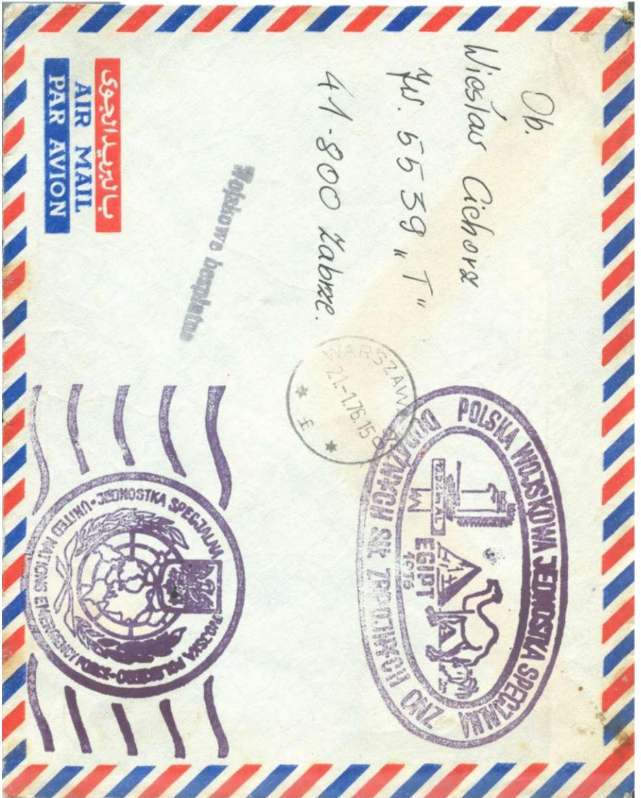
Afb. 5 Brief uit 1976 uit periode V met het algemene stempel symbool Verenigde Naties met golflijnen en een ovaal stempel met o.a. tekst Egypte 1976.