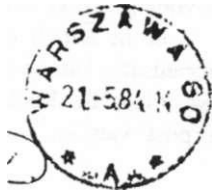
Afb. 4 Hel rondstempel 'Warszawa 60' dat bij aankomst op de post uit het Nabije Oosten geplaatst wordt.

Alle militaire post moet als dusdanig herkenbaar zijn. Alle brieven hebben het stempel "wojskowa-bezplatna" (militair-gratis) of in sommige gevallen "opłata pocztowa/zryczaltowana" (kosten post/kwijtschelding) (afb. 3). Deze stempels worden in Egypte en Syrië op de brieven geplaatst. Na aankomst in Warschau gaan de poststukken naar het verdeelkantoor en krijgen het aankomststempel "warszawa 60" met onderin tussen twee sterren een letter (afb. 4). Dit stempel wordt overigens op alle in Warschau binnenkomende post uit het buitenland geplaatst. Vanaf dat moment worden de poststukken in het normale postverkeer opgenomen.