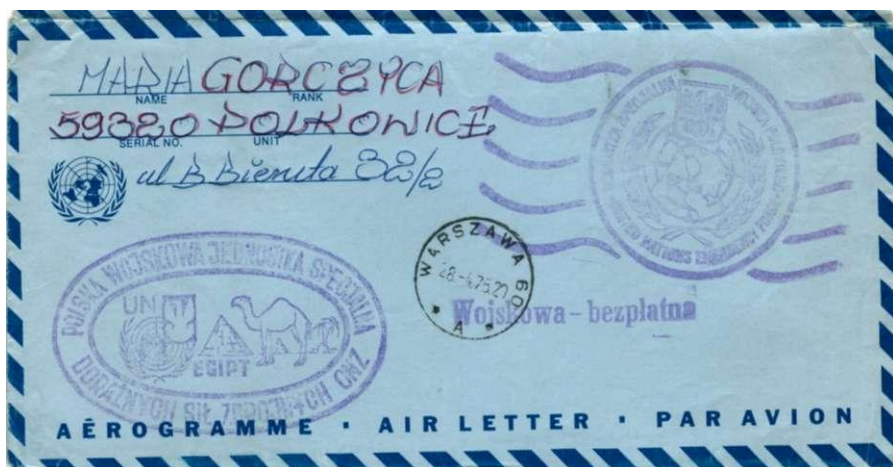
Afb. 10 Speciaal luchtpostblad van de VN voor militairen.