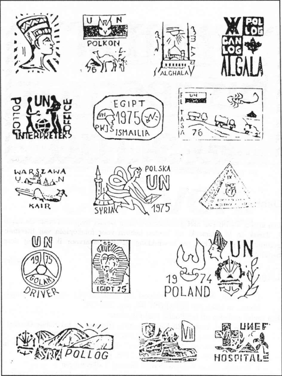
Af. 9 Diverse privaat stempels die op de post van Poolse VN militairen vanuit het Nabije Oosten kunnen voorkomen.