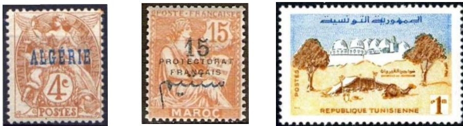
Afbeelding 4-6 zegels van Algerije, Marokko en Tunesië.

In Noord-Afrika behoorden de drie zogenaamde Maghreb-staten: Algerije, Marokko en Tunesië tot de Franse invloedssfeer.