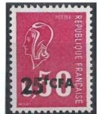
Afbeelding 8-10 zegels van Malagasy, Comoren en Réunion.

TOGO en KAMEROEN tenslotte, zijn voormalige Duitse koloniën, die na de Eerste Wereldoorlog mandaatgebieden werden van de Volkenbond en later als trustgebieden van de V.N. werden bestuurd door Frankrijk. Ook voor deze beide staten werd 1960 het jaar van de onafhankelijkheid.