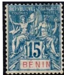
Afbeeldingen 2-3, eenheidsuitgiften.