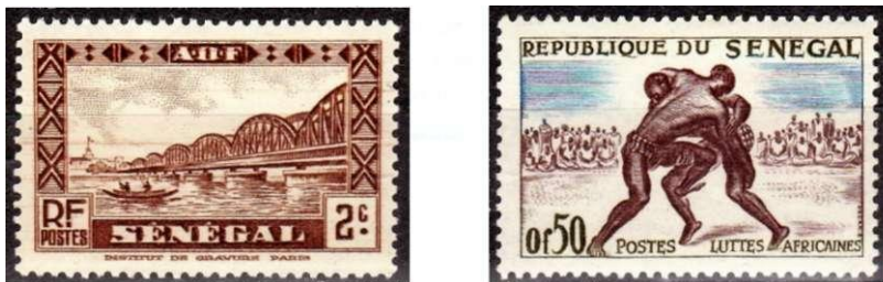
Afbeelding 7 Oude en nieuwe zegel van Senegal.

Zegels van voor en na de onafhankelijkheid van Senegal zijn te zien op afb. 7.