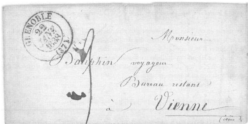
Franse brief uit 1838

Het eerste stuk is een franse brief, verzonden 22 januari 1838 van Grenoble naar Vienne (Isere) De brief is geadresseerd aan Monsieur Dauphin, voyageur, Bureau Restant, te Viene. Zoals in die tijd gewoon was diende de ontvanger het port te betalen. Het port werd in inkt op de brief geschreven (2 deciem, voor een enkelvoudige brief).