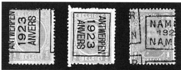
Afb 4. Stempels in stand A, B en C.

zijds juist een grotere waarborg dat men niet met een vervalsing te doen heeft, want alles wordt vervalst, dus ook voorafstempelingen.