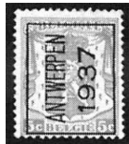
Afb 5. Antwerpen eentalig

Brussel (1906), Antwerpen (1909), Luik (1912), Gent (1912), Leuven (1914), Charleroi (1923) en Verviers (1929)