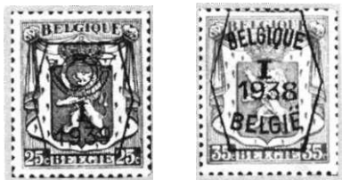
Afb 6. Typo's zeshoekig kastje

Later volgden zegels met daarop een geldigheidsduur. De perioden volgden elkaar niet precies op, maar overlaptten elkaar. De eerste zegels waren geldig van I-I-39 tot 31-XII-39, de volgende zegel was geldig van I-VII-39 tot 30-VI-40 enz. De laatste zegel in deze reeks was geldig van I-I-54 tot 31-XII-54.