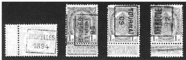
Afb. 2 Rolstempel Bruxelles, Bruges station, Tournai en Averbode.

In oktober 1894 werd in Brussel een rolstempel ingevoerd voor het afstempelen van hele vellen met zegels. Het betrof een eenvoudig stempel met hierin de naam Bruxelles en het jaartal 1894 in kastje (afb. 2). Hetzelfde jaar werden soortgelijke (franstalige) stempels in gebruik genomen in Anvers, Liege, Gand en Louvain.