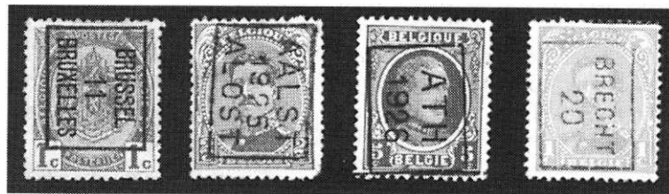
Afb. 3. Vernieuwde stempels in twee talen (Frans en Nederlands) voor zover de schrijfwijze verschilt.

In de loop der jaren is dit rolstempel verstrekt aan meer dan 100 plaatsen of bijkantoren (afb. 2). In 1911 werden de stempels tweetalig. Dit natuurlijk alleen bij die plaatsen waar de Franse en Nederlandse schrijfwijze van elkaar afweken bijv. bij Aalst-Alost, Antwerpen-Anvers en Bergen-Mons (afb. 3). Bij plaatsen als Ath, Aubel en Brecht veranderd de schrijfwijze niet in het Frans, dus in deze stempels werd de plaatsnaam slechts een keer vermeld (afb. 3).