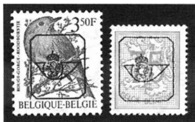
Afb 8. Moderne hoorn met leeuw.

Het verzamelgebied Preo's is uitermate geschikt voor speciaalverzamelaars. Alleen het samenbrengen van alle handvoorafstempelingen is al een levenswerk. Daarnaast biedt het verzamelgebied nog vele extra's welke in dit artikel onvermeld zijn gebleven, zoals bv kantdrukken, dubbeldrukken, voorafstempelingen met firmaperforaties, gom- en papiersoorten etc. Voor verdere informatie wijs ik u op het bestaan van de (Nederlandse) Studiegroep Voorafstempelingen.