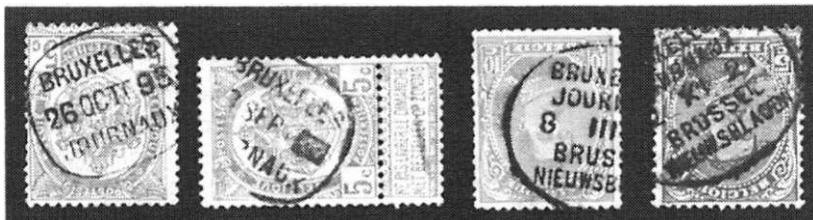
Af. 1. Dagbladstempel in Frans (links) en Frans-Nederlands (rechts).

De snelle uitbreiding van het spoorwegnet aan het eind van de vorige eeuw schiep voor de Posterijen de gelegenheid om post nog sneller dan voorheen te transporteren. Dit was niet alleen belangrijk voor het briefverkeer, maar ook voor de uitgevers van periodieken en dagbladen. Op zoek naar mogelijkheden om de weg van drukkerij naar lezer zo kort mogelijk te maken werd ook gekeken of het adresseren, plakken en stempelen van zegels al in de drukkerij kon plaatsvinden, zodat de aflevering zo min mogelijk werd vertraagd en de kranten rechtstreeks naar het station konden worden gebracht. In Brussel werd in december 1893 het gebruik van een speciaal dagbladstempel toegestaan, (afb. 1)